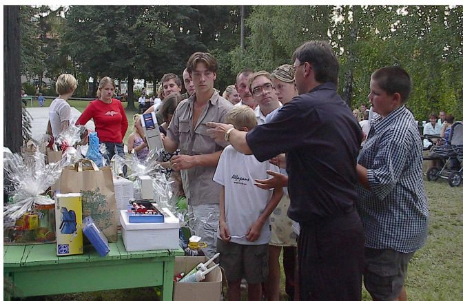
Velká fronta při vydávání cen z tomboly