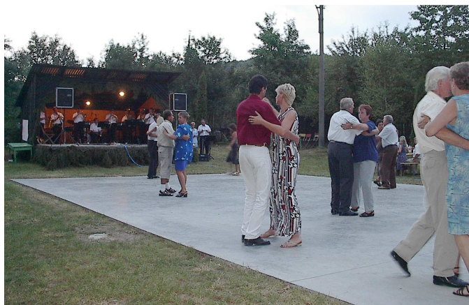
Z nedělní taneční zábavy...